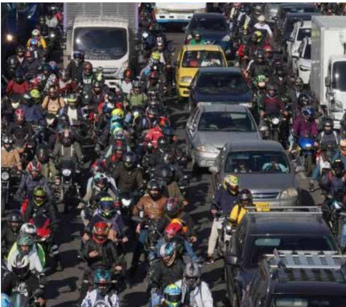
La gente determinó comprar motocicletas como consecuencia del pésimo servicio de transporte urbano.

Las cifras, frías y contundentes, pintan un panorama inquietante. En lo que va del 2024, más de 4.500 celulares han sido robados en TransMilenio, y en 2023, los hurtos a personas superaron los