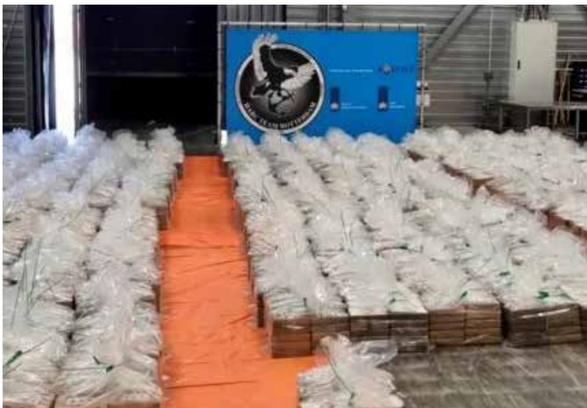
Cargamento de ocho toneladas de cocaína

Las autoridades asestan golpes contundentes al narcotráfico, afectando incluso a individuos que, irónicamente, se autodenominan «gente de bien» y lamentan que las operaciones policiales «perjudican su emprendimiento».