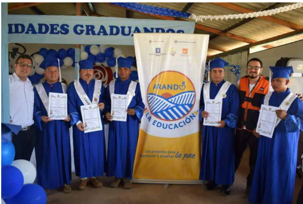
El proyecto «Arando la Educación», financiado por la Embajada de Noruega, ha sido clave en este logro. De los 18.000 beneficiarios, más de un tercio se ha graduado del bachillerato, y un impresionante 9 de cada 10 han mantenido su permanencia en el proceso educativo.