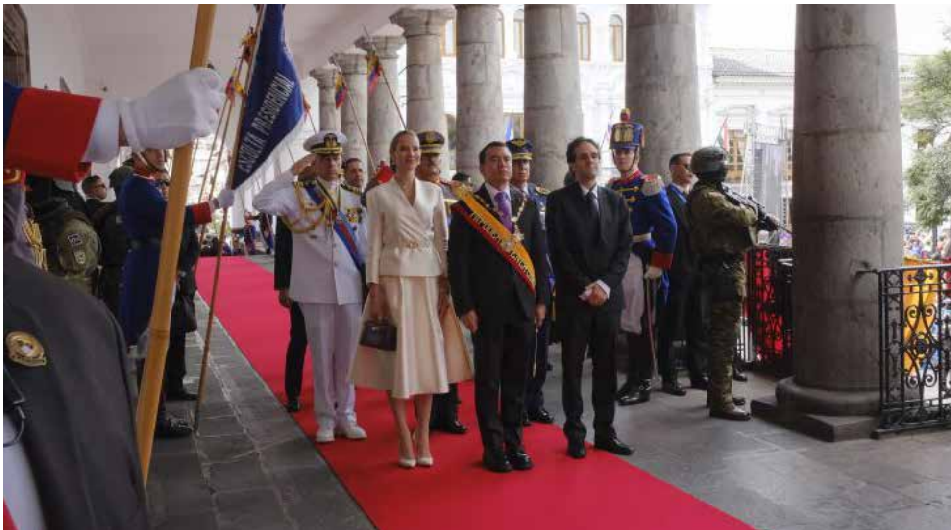
El presidente de Ecuador, Daniel Noboa Azín, asumió hoy su segundo mandato presidencial, acompañado de su esposa, la primera dama Lavinia Valbonesi, en la ceremonia oficial en Quito.