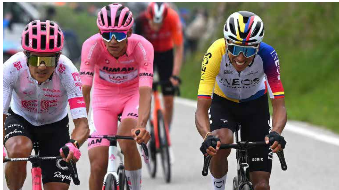
El colombiano Egan Bernal entre los mejores del Giro a Italia.