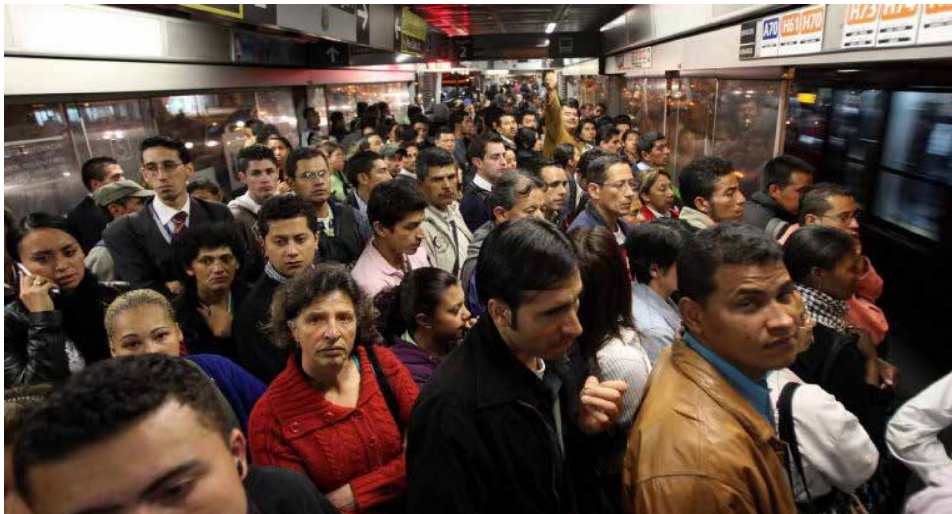
El transporte urbano en Bogotá es un caos

B ogotá, una ciudad que se estira y se reinventa a cada amanecer, guarda en sus entrañas una historia vibrante y a veces agri dulce: la de su transporte urbano. Desde los balbuceos del siglo XIX, con sus tranvías impulsados por mulas, hasta el rugido constante de los buses articulados de TransMilenio y el SITP, la movilidad ha sido siempre el gran desafío, un reflejo del alma misma de la capital colombiana. Esta no es solo una crónica de vehículos, sino de tiempos robados, esperas infinitas y la sombra persistente de la inseguridad que acompaña a millones de bogotanos en su diario transitar.