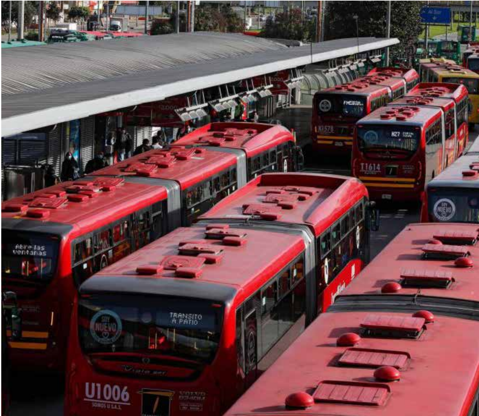
El servicio urbano de transporte es una clara violación contra los derechos humanos

tre la anticipación y la resignación que impacta directamente su productividad y, en última instancia, su calidad de vida.