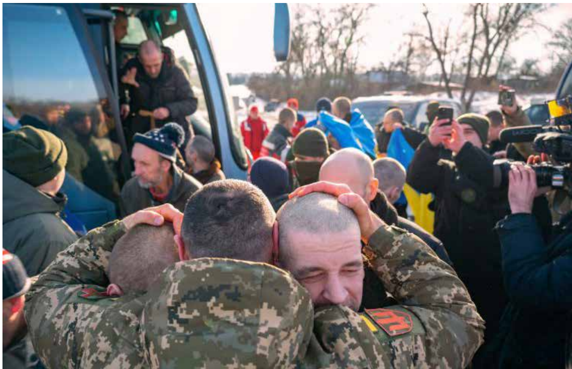
Este canje masivo, logrado gracias a los acuerdos de Estambul, es visto como un paso humanitario crucial que, a pesar de las profundas divisiones en otros temas

El Ministerio de Defensa ruso y el Cuartel General de Coordinación para el