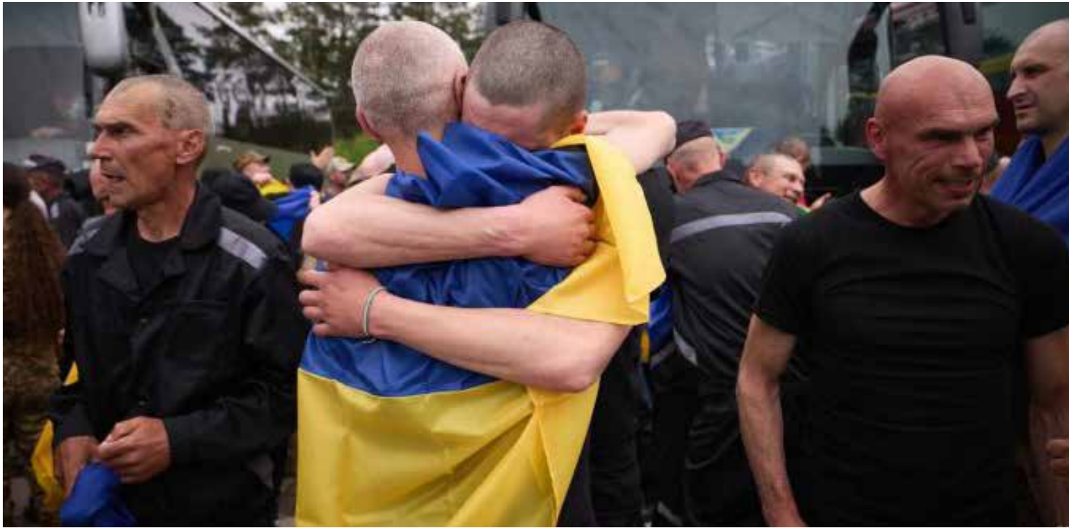
Liberación de cerca de 2.000 personas en un periodo de tres días. La entrega de prisioneros se presentó en plena guerra de Rusia-Ucrania.

Rusia y Ucrania protagonizan el intercambio de prisioneros más grande de la guerra