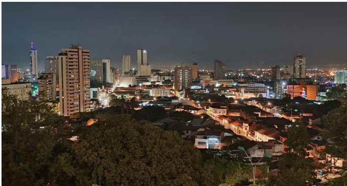
Panorámica nocturna de Cali

La capital vallecaucana ha figurado constantemente en los últimos años en listados internacionales de violencia, alimentando la percepción de que es una de las ciudades más peligrosas del mundo. Si bien las cifras y los rankings pueden variar, la realidad es que Cali enfrenta desafíos significativos en materia de seguridad que demandan atención y acción.