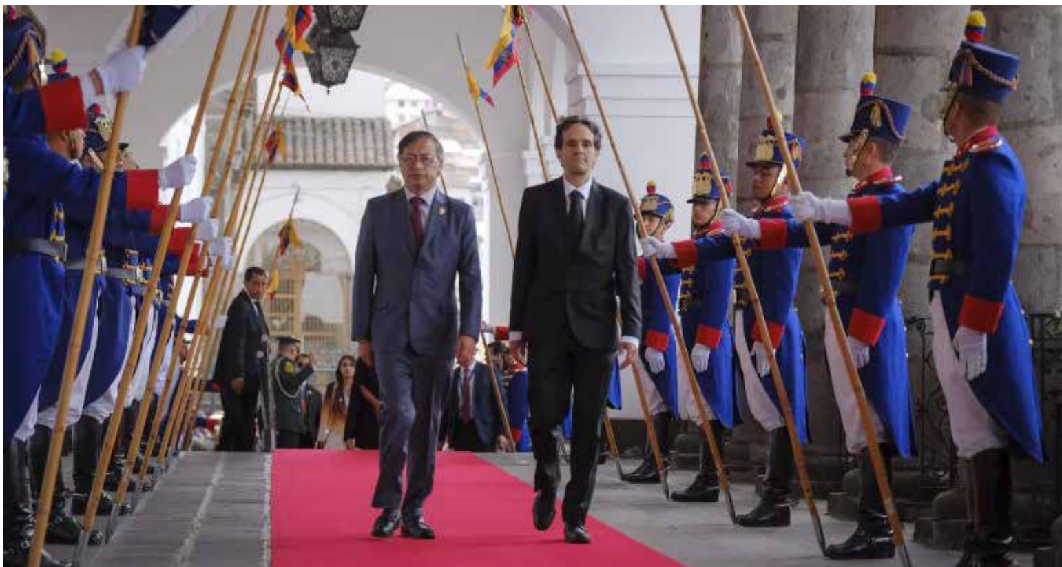
El presidente de Colombia, Gustavo Petro Urrego, fue recibido con honores militares a su llegada al acto de toma de posesión del nuevo presidente de Ecuador, Daniel Noboa, en la capital ecuatoriana.