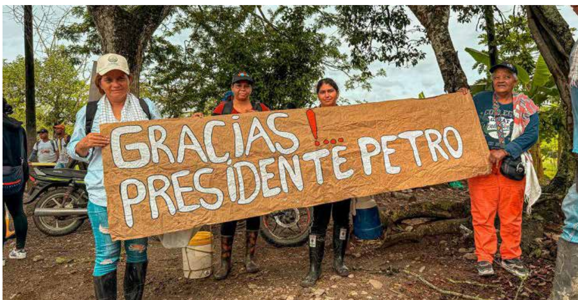
Gobierno entregó en Santander predios usurpados por exparas a campesinos del Magdalena Medio. Los campesinos agradecen.

el convenio de 2024 entre la SAE y la ANT, que prevé 24.336 hectáreas para esta región.