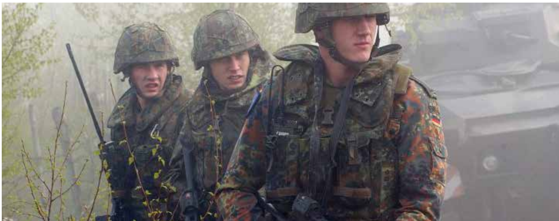
Soldados alemanes duran un ejercicio militar

L a humanidad no parece aprender de ninguna de sus guerras, ni siquiera ahora que la modernidad ha reemplazado con drones y misiles los aviones y los tanques de guerra. Cuando hace 80 años terminó la guerra mundial, los aliados vencedores le pusieron tanto a Alemania como al Japón, la prohibición de que tuviesen ejércitos nuevamente y que se rearmarían. Era lo menos después de que uno y otro país cau-