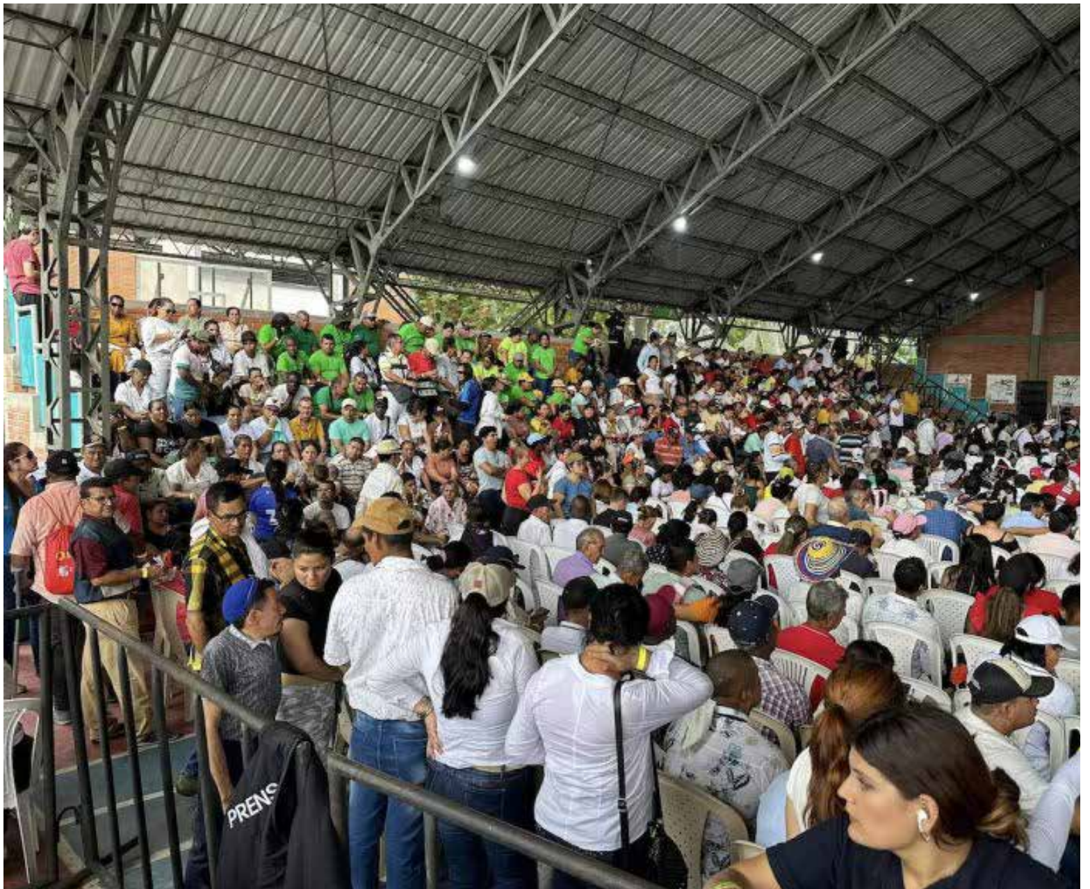
El presidente Gustavo Petro lideró la entrega de tierras recuperadas del despojo paramilitar a campesinos en el Magdalena Medio, como parte de su compromiso con la justicia agraria y la reparación histórica en Colombia.

Este evento no es solo una entrega de tierras; es un paso audaz en la Reforma Agraria del Gobierno, una política orientada a sanar heridas, democratizar el acceso a la tierra y reparar a quienes han resistido y cultivado con tenacidad. Se enmarca en