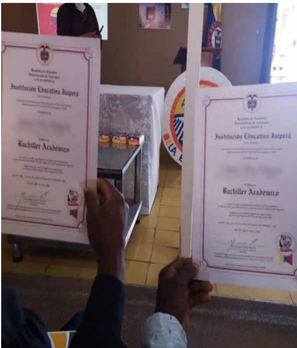
En el corregimiento de Mandé (Urrao – Antioquia), 6 excombatientes en reincorporación lograron este título gracias a 'Arando la Educación', un modelo educativo financiado por @NRC_LAC y @MinEducacion, con acompañamiento de @ARNColombia.

72 años que ingresó por primera vez a un aula gracias a este proyecto, resume el impacto transformador: «Antes me daba vergüenza cuando iba a firmar y no podía, pero ahora ya puedo firmar mi nombre».