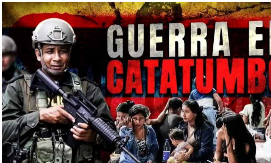
La lluvia sigue llorando en Gaza, el Catatumbo, el Cauca y el Chocó. Una lluvia que anhela limpiar de odio y egoísmo nuestros corazones.