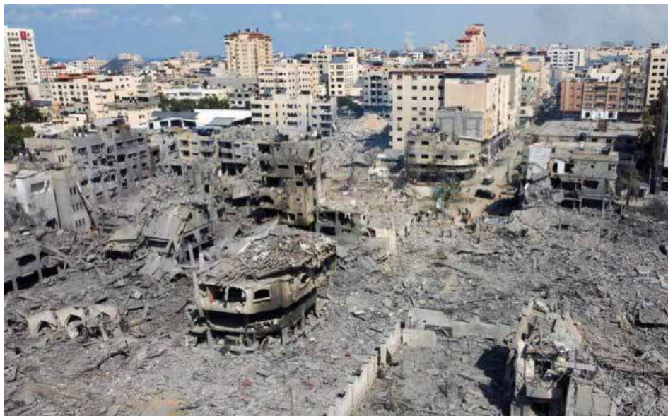
Gaza, un grito desesperado